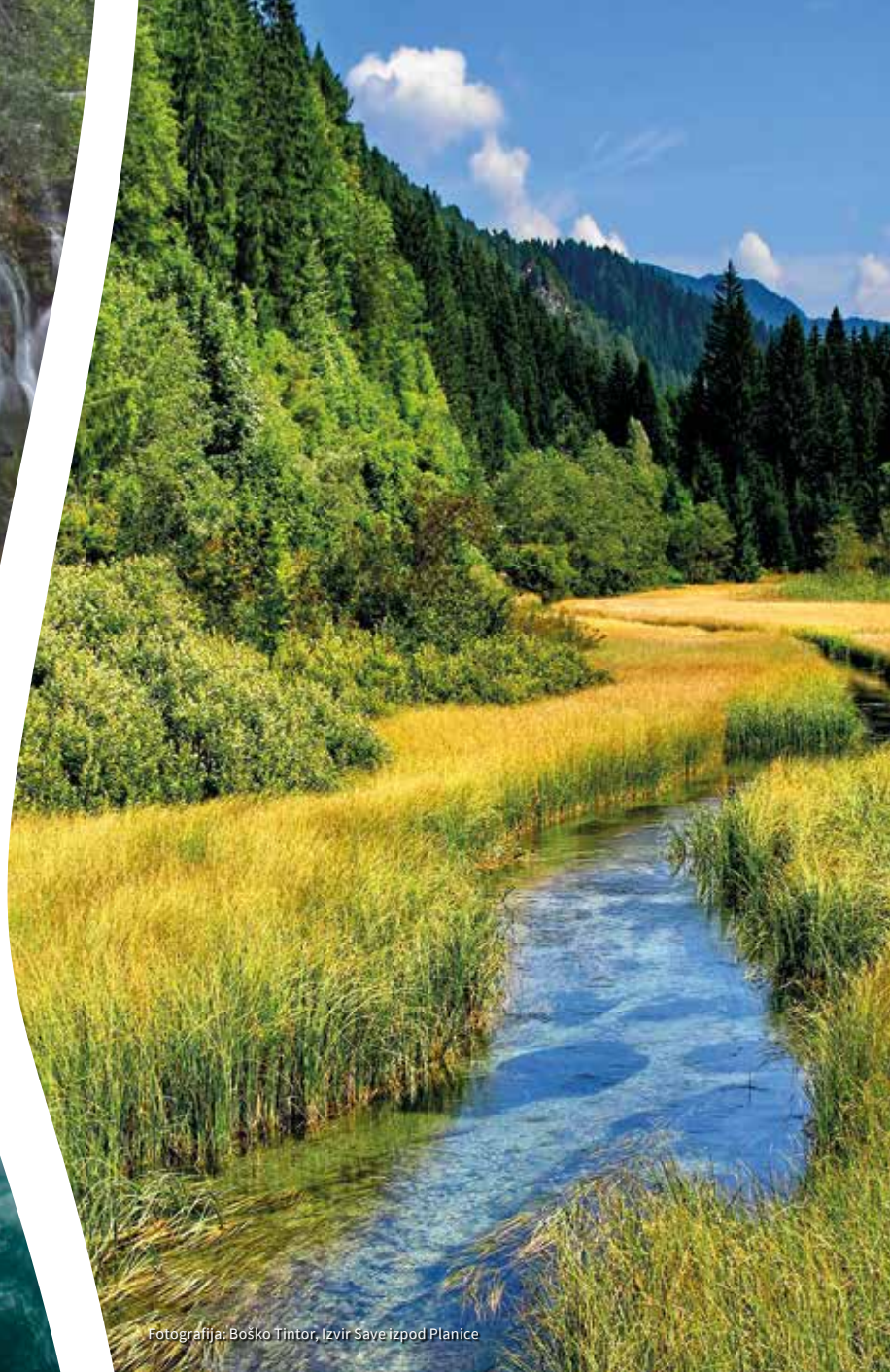
Izvir Save izpod Planice