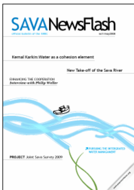
Slika 2. Službeni bilten Savske komisije počeo je izlaziti u svibnju 2008.

Većina aktivnosti je ostvarena uz podršku kompanije “Coca Cola Beverages” iz Republike Hrvatske i Republike Srbije, kao i MIO-ECSDE.