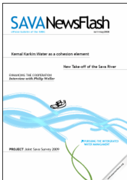
Slika 2. Službeni bilten Savske komisije pokrenut u maju 2008.

Većina aktivnosti realizirana je uz podršku kompanije “Coca Cola Beverages” iz Republike Hrvatske i Republike Srbije, kao i MIO-ECSDE.