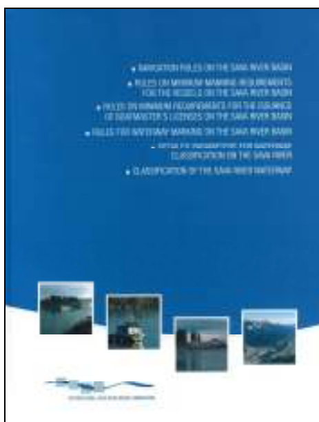
Slika 3. Publikacija pravila Savske komisije i ostalih dokumenata iz područja plovidbe